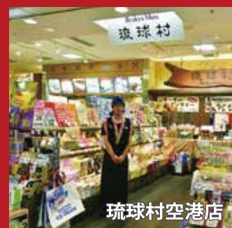
琉球村 那覇空港店