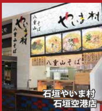
石垣やいま村 石垣空港店