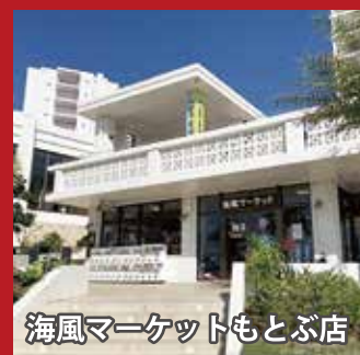
海風マーケットもとぶ店