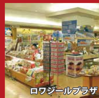
ロワジュールプラザ