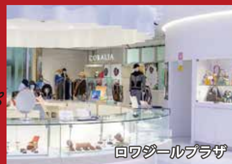
ロワジュールプラザ