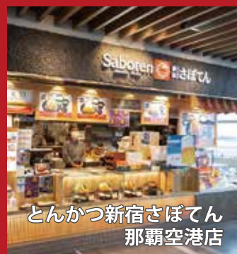
とんかつ新宿さぼてん 那覇空港店