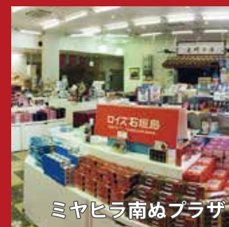
ミヤヒラ南ぬプラザ