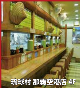
琉球村 那覇空港店 4F