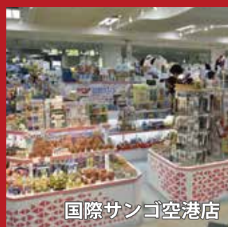
国際サンゴ空港店